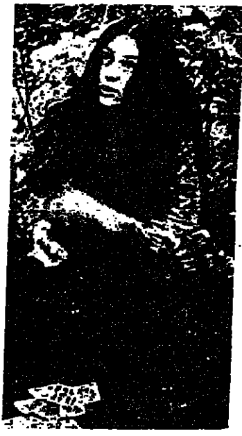
سفلاتانوما في دور رادا

ويتلون افرادها بحثا عنه ثم يقبضون عليه في حانة ويقربون شفته في الوقت التي ترفض فيه رادا بعد ان تسخر سياتنا من النبيل عرشفه عليها بالزواج الا ان زويار ، يفر اتاه تنفيذ الاوامر بمساعدة صديقه الذي يقتل ليمود السى رادا التي تطلبه بالخروج لها اسم الخير تصنع زوجته الا ان عملية الاحتفال بهذا الزواج لا تتم الا ان زويار يفقد خنجره في صدر رادا التي لا تصنع لرفيقه في مسك يداه قبل ان يرجم فياني والدها وتفيد بدوره خنجره في ظهر زويار وتنتهي المأساة بنهب عجزري للماشيقين المتكوري الحظ سواء . بقي القول بان الفيلم مأخوذ عن قصة مكسيم غوركي الكاتب الروسي والفيلم الكبير وهذه ايضا ميزة كبيرة تعطي الفيلم الذي نامل ان تكون اعطياناه في قيمتها بعض ما يستحقه من تقدير .